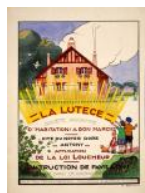
1929-1937. Cité-jardin du Noyer Doré, Antony : affiche publicitaire. (Dossier 174 Ifa 56/2. Doc. AR-02-04-09-11)