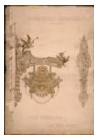
1898-1905. Travaux d'école (ENSBA). "Une enseigne en fer forgé" (concours Godeboeuf) : étude, n.d. (Dossier 174 Ifa 100. Doc. AR-06-02-08-06)