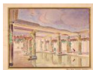
1927-1928. Aménagement intérieur du cabaret Le Lido, avenue des Champs-Élysées, Paris 8e : dessin d'étude pour le décor peint. (Dossier 174 Ifa 55/4. Doc. AR-06-02-08-36)