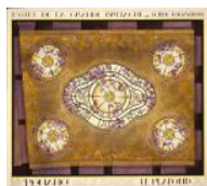
Reconstruction de l'Hôtel de la Grande-Bretagne, rue Caumartin, Paris 9e : décor du plafond du restaurant (éch. 0,05 PM). (Dossier 174 Ifa 53/2. Doc. AR-02-04-09-02)