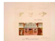
1927-1928. Grill-room Le Wellington, rue de Ponthieu, Paris 8e : élévation int. et dessins d'étude pour les plafonniers (éch. 0,05 PM), n.d. (Dossier 174 Ifa 50/4. Doc. AR-06-02-08-32)