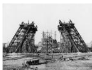
Gustave Eiffel (ing.). 1889. Tour Eiffel, Paris 7e : vue de la construction des piliers de la Tour, 7 déc. 1887. (Sélection de documents numérisés représentatifs du fonds. Doc. AR-20-07-09-07)