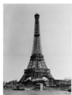
Gustave Eiffel (ing.). 1889. Tour Eiffel, Paris 7e : vue de la Tour jusqu'au 3e étage et le début du lanternon, 15 mars 1889. (Sélection de documents numérisés représentatifs du fonds. Doc. AR-20-07-09-06)