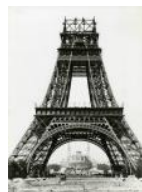
Gustave Eiffel (ing.). 1889. Tour Eiffel, Paris 7e : vue de la Tour jusqu'au dessus de la 2e plate forme, 11 sept. 1888. (Sélection de documents numérisés représentatifs du fonds. Doc. AR-20-07-09-02)