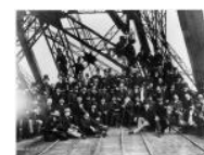
Gustave Eiffel (ing.). 1889. Tour Eiffel, Paris 7e : vue de la réception de la Presse parisienne sur la première plate-forme de la Tour Eiffel, 4 juil. 1888. (Sélection de documents numérisés représentatifs du fonds. Doc. AR-20-07-09-11)