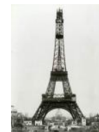
Gustave Eiffel (ing.). 1889. Tour Eiffel, Paris 7e : vue de la Tour presque juqu'au troisième étage, 2 fév. 1889. (Sélection de documents numérisés représentatifs du fonds. Doc. AR-20-07-09-01)