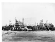
Gustave Eiffel (ing.). 1889. Tour Eiffel, Paris 7e : vue de la construction des piliers de la Tour, août 1887. (Sélection de documents numérisés représentatifs du fonds. Doc. AR-20-07-09-04)