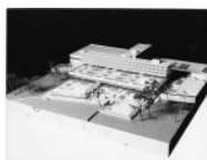
1969-1976. Immeubles et équipements, Cergy-Pontoise : vue de la maquette, n.d. (cliché anonyme). (Dossier 224 Ifa 1009/6. Doc. AR-27-05-09-02)