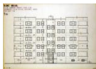
1956-1964. Cité Les Blés-d'Or, Le Blanc-Mesnil : élévation de la façade latérale nord des bâtiments types I, II et III (éch. 1/50e), 5 oct. 1956 (modifié le 18 mai 1960). (Dossier 200 Ifa 670. Doc. FD-26-01-07-16)